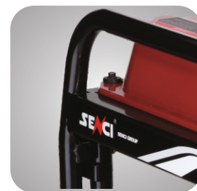
Cadru tratat pentru a preveni ruginirea