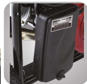
Filtru de aer patentat