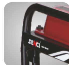
Cadru tratat pentru a preveni ruginirea