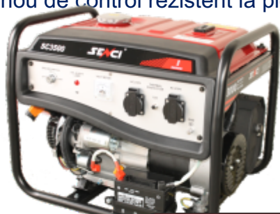
SC-3500E Lite (baterie inclusa)