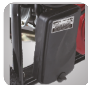
Filtru de aer patentat