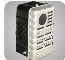
Esapament unic ce reduce zgomotul