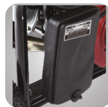
Filtru de aer patentat