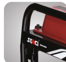
Cadru tratat pentru a preveni ruginirea