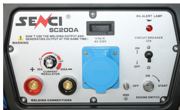
Panou de control