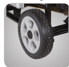
Kit roti si manere