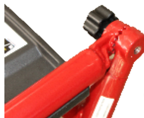
Manere pliabile, pentru depozitare si transport eficient