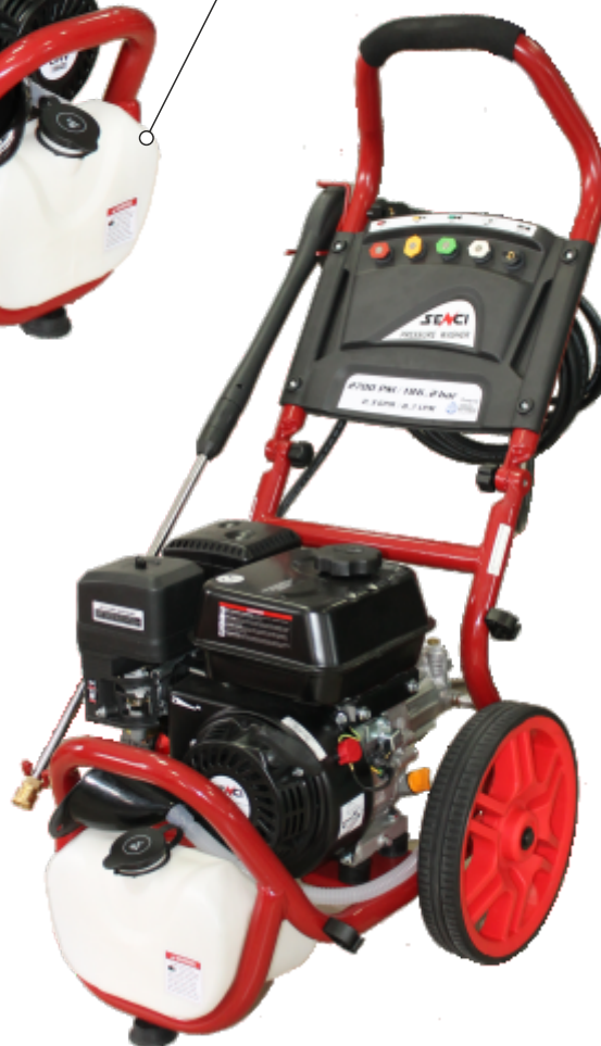
Recipient pentru detergent

Roti mari pentru a fi mai usor de transportat pe teren accidentat