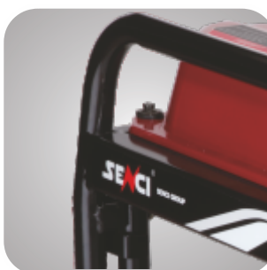
Cadru tratat pentru a preveni ruginirea