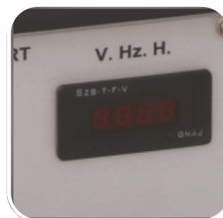
Contor ore, voltmetru si frecventa